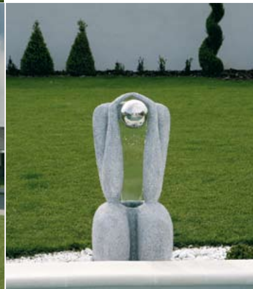
Na okraji bazény je učupený jeho strážca - kamenná fontánka, ktorá zatriktívňuje záhradné prostredie