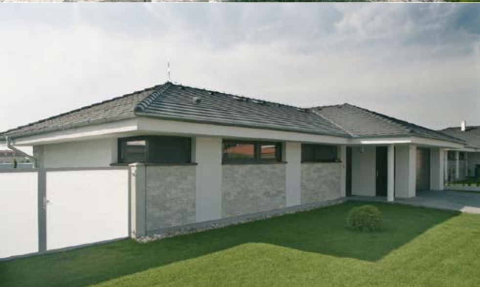
Kombinácia bielej omietky a imitácie kamenného obkladu vytvára elegantnú fasádu nielen z uličnej časti. vstup do domu je mierne zapustený a vstup do garáže zase vysunutý.

V druhej časti domu je nočná zóna so spálňou rodičov a dve izby pre deti. Priestor detských izieb je zväčšený o plochu na spanie umiestnenú nad