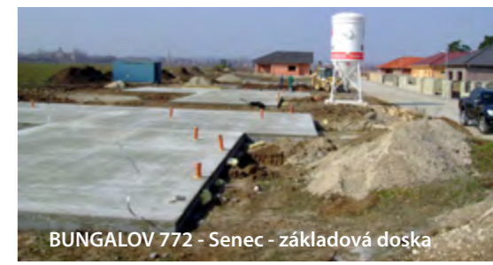
BUNGALOV 772 - Senec - základová doska