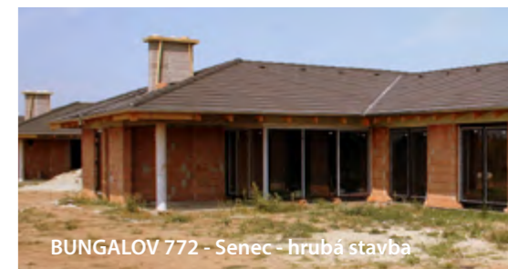
BUNGALOV 772 - Senec - hrubá stavba