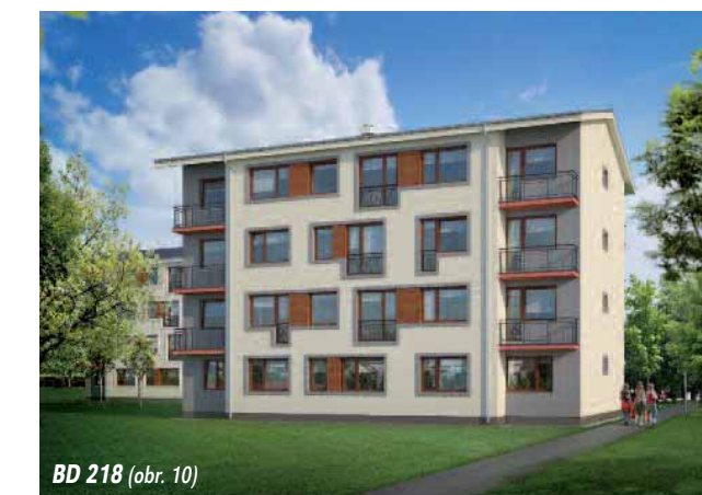
BD 218 (obr. 10)

Firme Euroline záleží na peknom bývaní aj tých, ktorí sa rozhodli pre bývanie v bytových domoch. Preto rozširuje aj ponuku svojich bytových domov. Sú vhodné do nižších zástavieb, v ktorých ľudia nestrácajú kontakt s blízkym okolím. Bytové domy Euroline sú príjemnou alternatívou medzi bývaním na preľudnených sídliskách a rodinným domom (obr. 10).