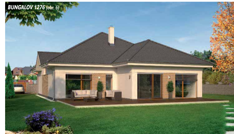
BUNGALOV 1276 (obr. 6)

moderná architektúra a chcú kráčať s posledným trendom. Vily svojou eleganciou zapadnú nielen do mestského prostredia, ale rovnako aj do prímestských častí (obr. 3,4). Medzi novinkami sú aj praktické dvojpodlažné domy PRAKTIK (obr. 2). A nechýbajú ani obľúbené BUNGALOVY, ktorých je spolu už 131. Tento typ domu bezprostredne prepája útulnosť domova s krásou okolia (obr. 7,8,9). Tvar a výška strechy niektorých bungalovov dovoľujú architektom využiť aj podstrešný priestor, v ktorom umiestnili herňu pre deti, ateliér, alebo pracovňu (obr. 6).