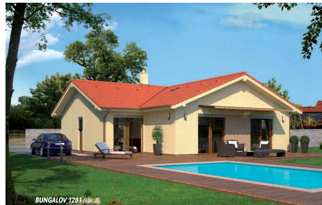
BUNGALOV 1281 (obr. 8)