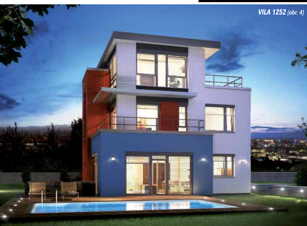
VILA 1252 (obr. 4)