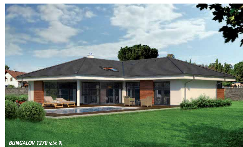
BUNGALOV 1270 (obr. 9)