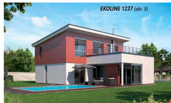
EKOLINE 1237 (obr. 5)