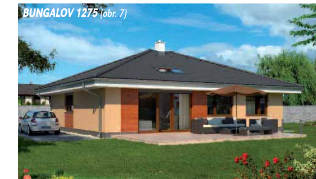
BUNGALOV 1275 (obr. 7)

moderná architektúra a chcú kráčať s posledným trendom. Vily svojou eleganciou zapadnú nielen do mestského prostredia, ale rovnako aj do prímestských častí (obr. 3,4). Medzi novinkami sú aj praktické dvojpodlažné domy PRAKTIK (obr. 2). A nechýbajú ani obľúbené BUNGALOVY, ktorých je spolu už 131. Tento typ domu bezprostredne prepája útulnosť domova s krásou okolia (obr. 7,8,9). Tvar a výška strechy niektorých bungalovov dovoľujú architektom využiť aj podstrešný priestor, v ktorom umiestnili herňu pre deti, ateliér, alebo pracovňu (obr. 6).