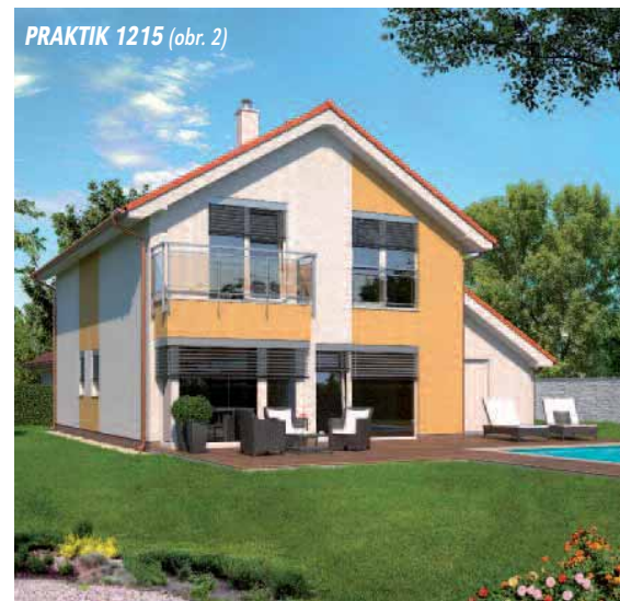
PRAKTIK 1215 (obr. 2)