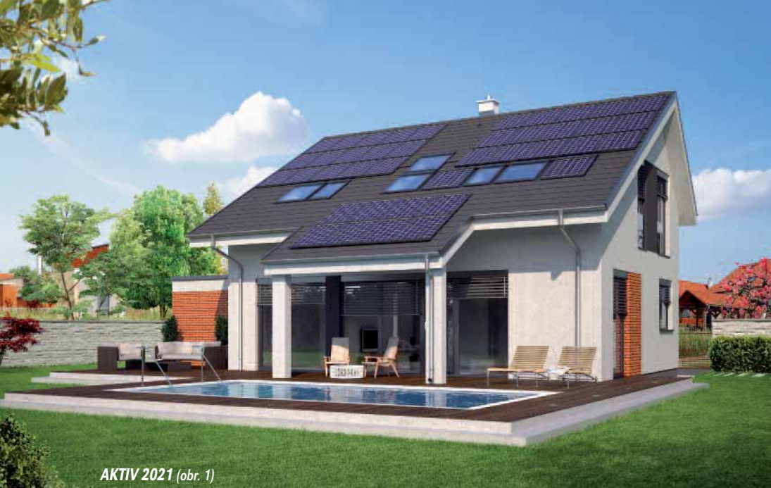
AKTIV 2021 (obr. 1)