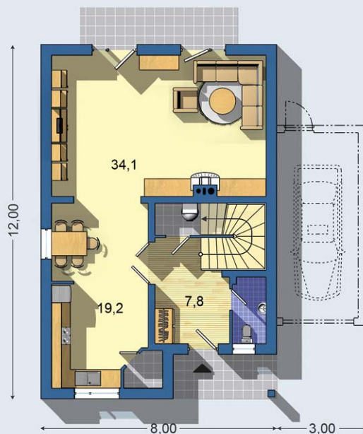
PRÍZEMIE [celková plocha 73.9 m 2 ]