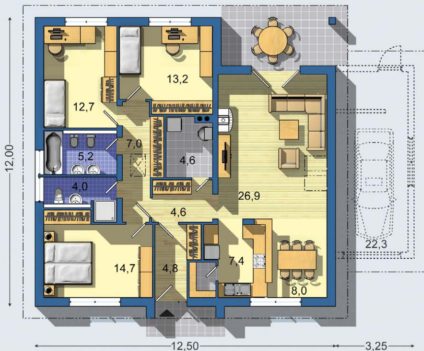
PRÍZEMIE [celková plocha 114.7 m 2 ]