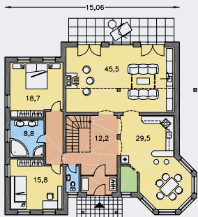
PRÍZEMIE [plocha 150.3 m 2 ]

CENA STAVEBNÉHO MATERIÁLU UŽ OD 185 200 €