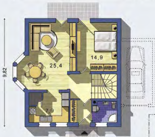
PRÍZEMIE [celková plocha 66.0 m 2 ]