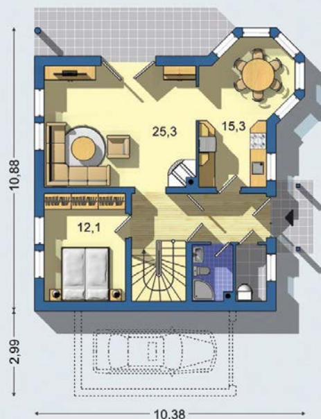
PRÍZEMIE [celková plocha 73.4 m 2 ]