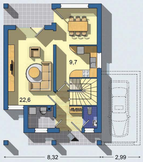
POSCHODIE [plocha 69.4 m 2 ]