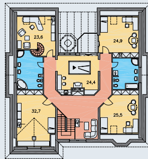
POSCHODIE [plocha 123.2 m 2 ]