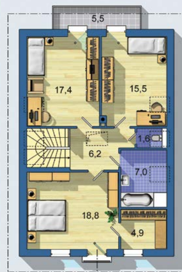
POSCHODIE [celková plocha 76.9 m 2 ]