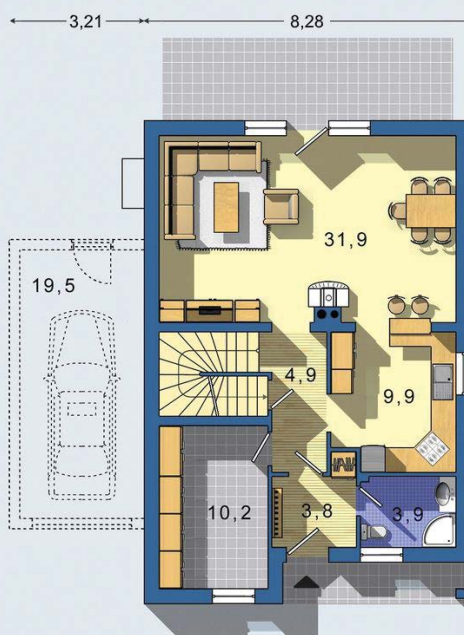
PRÍZEMIE [celková plocha 73.3 m 2 ]