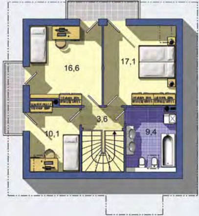
POSCHODIE [celková plocha 65.2 m 2 ]

Spôsob vykurovania: radiátory Predpokladané náklady na vykurovanie pre zdroj: plynový kotol 29 €/mesiac