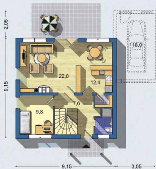
PRÍZEMIE [celková plocha 60.4 m 2 ]