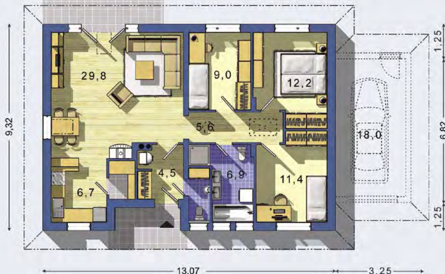
PRÍZEMIE [celková plocha 90.0 m 2 ]

Návrh dispozície pôdorysu rodinného domu je architektonickým dielom podľa § 3 ods. 6 Autorského zákona č. 185/2015 zb. Jeho porušenie je trestné podľa § 283 Trestného zákona.