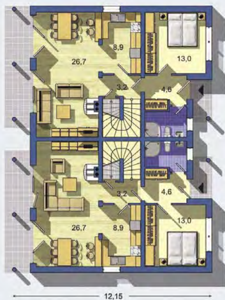
PRÍZEMIE [celková plocha 2 x 67.5 m 2 ]