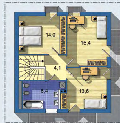
POSCHODIE [plocha 69.4 m 2 ]