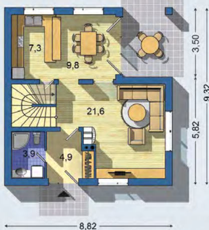
PRÍZEMIE [plocha 54.3 m 2 ]