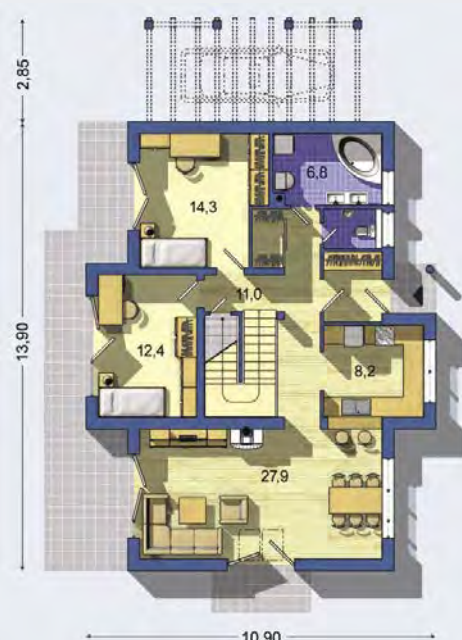
PRÍZEMIE [celková plocha 98.1 m 2 ]