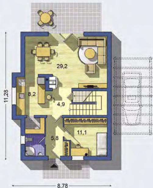
PRÍZEMIE [celková plocha 73.2 m 2 ]