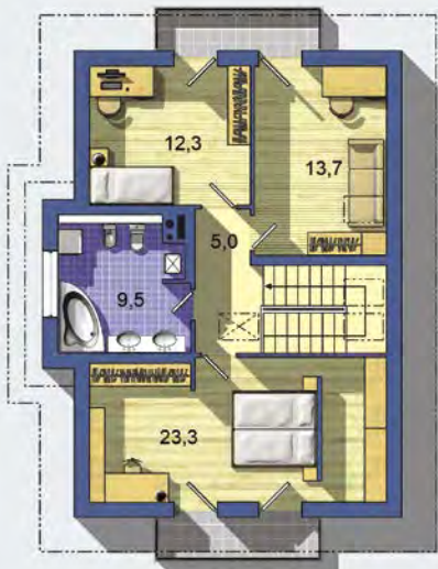
POSCHODIE [celková plocha 72.1 m 2 ]

Návrh dispozície pôdorysu rodinného domu je architektonickým dielom podľa § 3 ods. 6 Autorského zákona č. 185/2015 zb. Jeho porušenie je trestné podľa § 283 Trestného zákona.