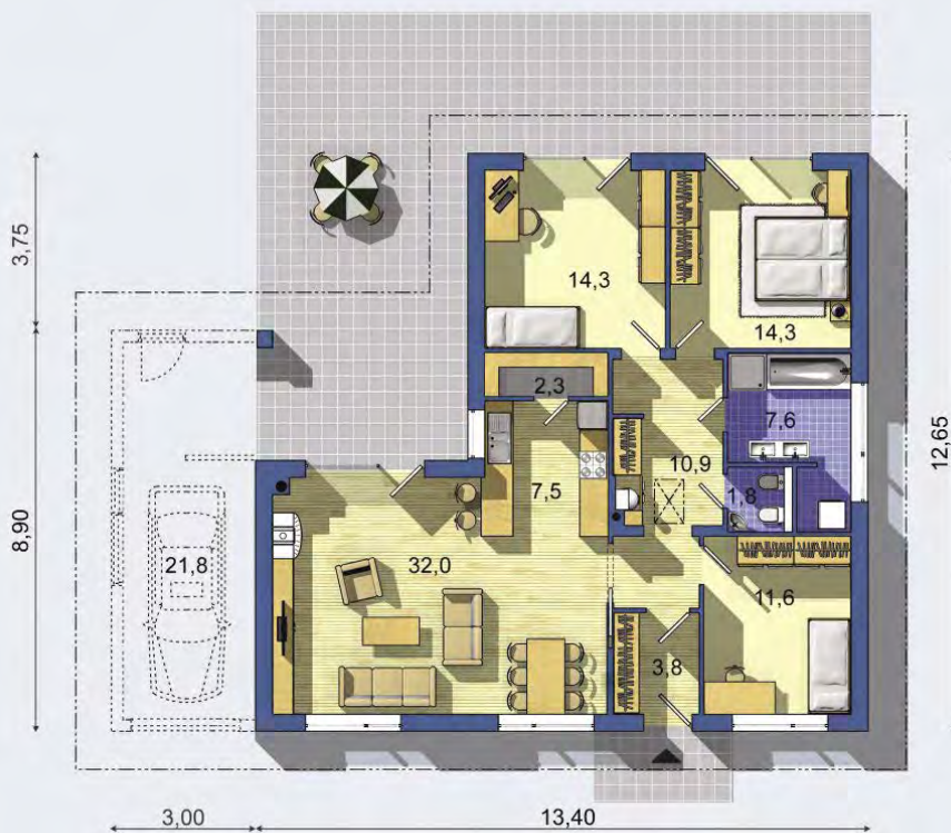
PRÍZEMIE [celková plocha 106.2 m 2 ]

Návrh dispozície pôdorysu rodinného domu je architektonickým dielom podľa § 3 ods. 6 Autorského zákona č. 185/2015 zb. Jeho porušenie je trestné podľa § 283 Trestného zákona.