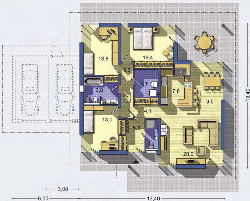
PRÍZEMIE [celková plocha 119.6 m 2 ]

Návrh dispozície pôdorysu rodinného domu je architektonickým dielom podľa § 3 ods. 6 Autorského zákona č. 185/2015 zb. Jeho porušenie je trestné podľa § 283 Trestného zákona.