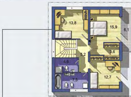
POSCHODIE [celková plocha 69.4 m 2 ]

Návrh dispozície pôdorysu rodinného domu je architektonickým dielom podľa § 3 ods. 6 Autorského zákona č. 185/2015 zb. Jeho porušenie je trestné podľa § 283 Trestného zákona.