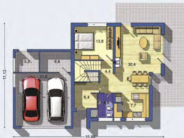
PRÍZEMIE [celková plocha 120.0 m 2 ]