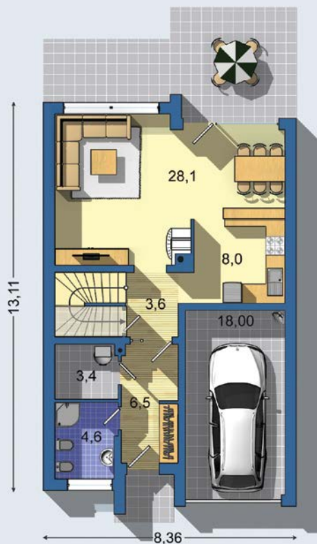
PRÍZEMIE [celková plocha 78.5 m 2 ]