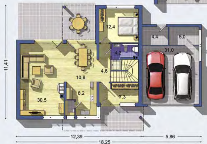
PRÍZEMIE [celková plocha 125.1 m 2 ]