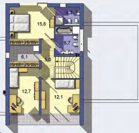
POSCHODIE [celková plocha 69.4 m 2 ]