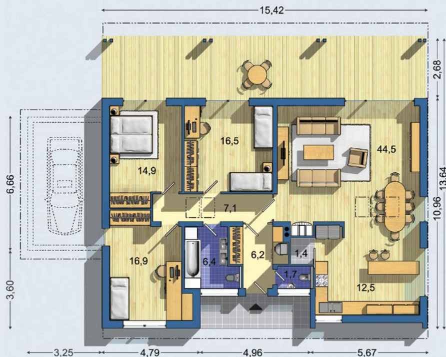
PRÍZEMIE [celková plocha 132.2 m 2 ]

Návrh dispozície pôdorysu rodinného domu je architektonickým dielom podľa § 3 ods. 6 Autorského zákona č. 185/2015 zb. Jeho porušenie je trestné podľa § 283 Trestného zákona.