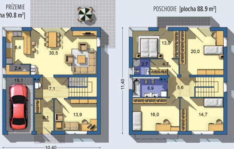
POSCHODIE [plocha 88.9 m 2 ]