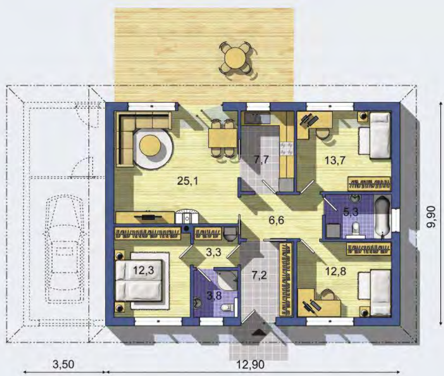
PRÍZEMIE [celková plocha 97.7 m 2 ]