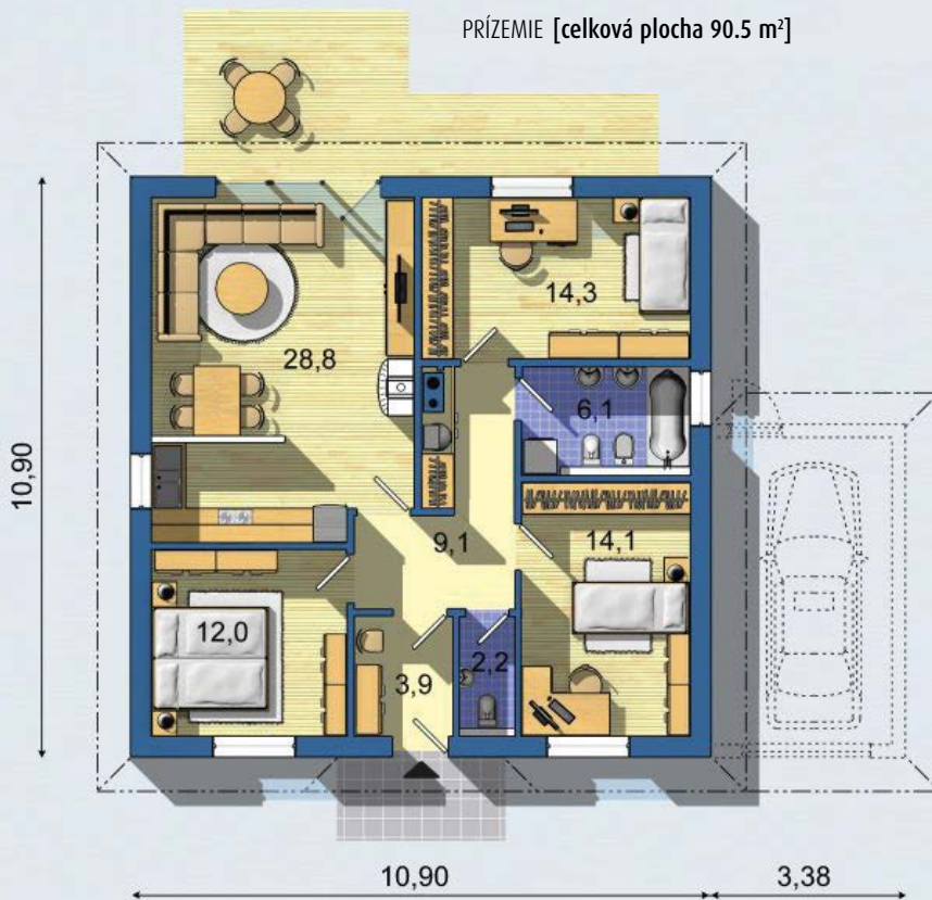
PRÍZEMIE [celková plocha 90.5 m 2 ]

Návrh dispozície pôdorysu rodinného domu je architektonickým dielom podľa § 3 ods. 6 Autorského zákona č. 185/2015 zb. Jeho porušenie je trestné podľa § 283 Trestného zákona.