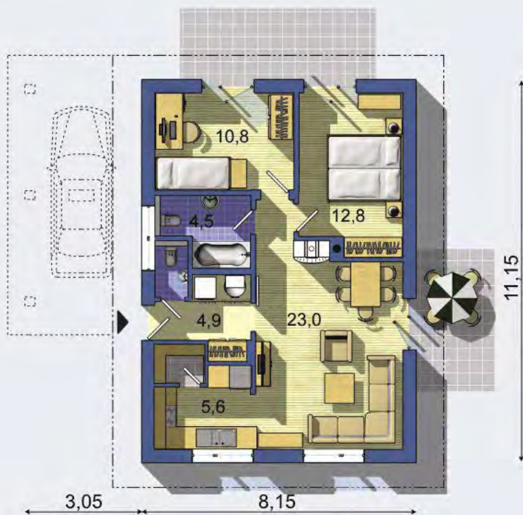
PRÍZEMIE [celková plocha 65.9 m 2 ]

Návrh dispozície pôdorysu rodinného domu je architektonickým dielom podľa § 3 ods. 6 Autorského zákona č. 185/2015 zb. Jeho porušenie je trestné podľa § 283 Trestného zákona.