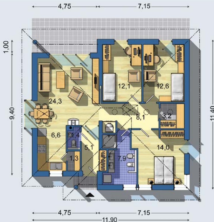
PRÍZEMIE [celková plocha 96.4 m 2 ]

Návrh dispozície pôdorysu rodinného domu je architektonickým dielom podľa § 3 ods. 6 Autorského zákona č. 185/2015 zb. Jeho porušenie je trestné podľa § 283 Trestného zákona.