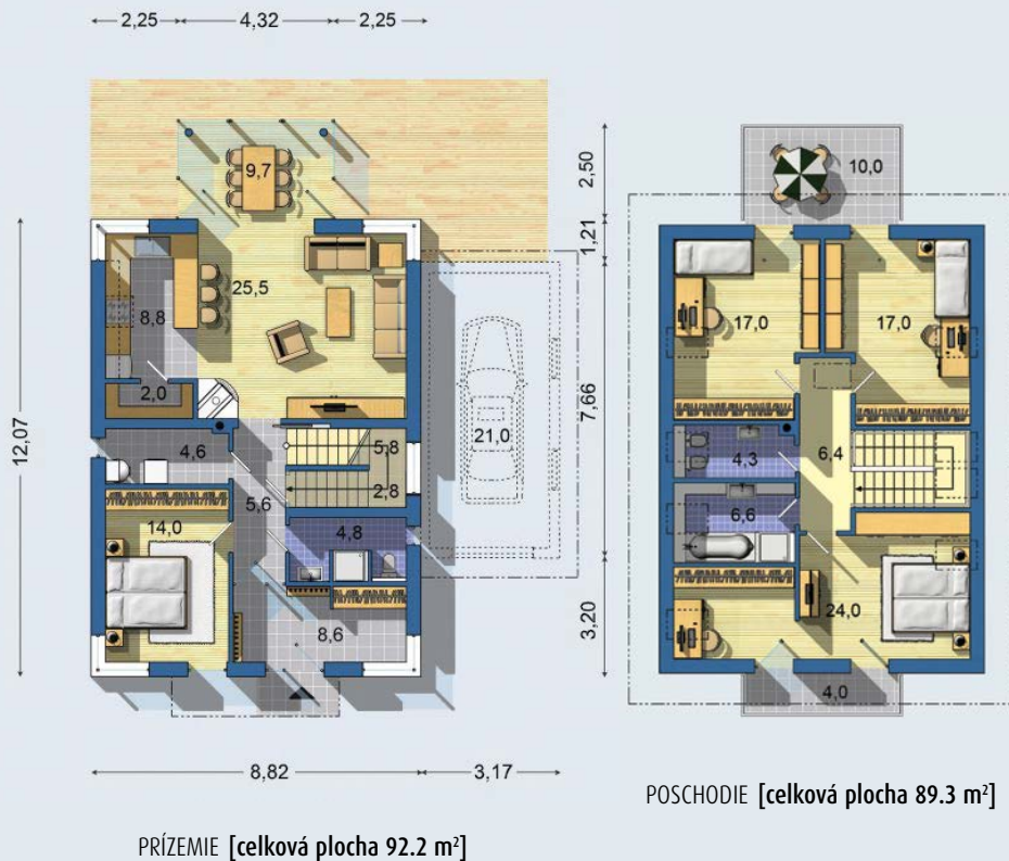
PRÍZEMIE [celková plocha 92.2 m 2 ]