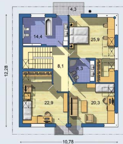
POSCHODIE [celková plocha 97.8 m 2 ]

Návrh dispozície pôdorysu rodinného domu je architektonickým dielom podľa § 3 ods. 6 Autorského zákona č. 185/2015 Zb. Jeho porušenie je trestné podľa § 283 Trestného zákona.