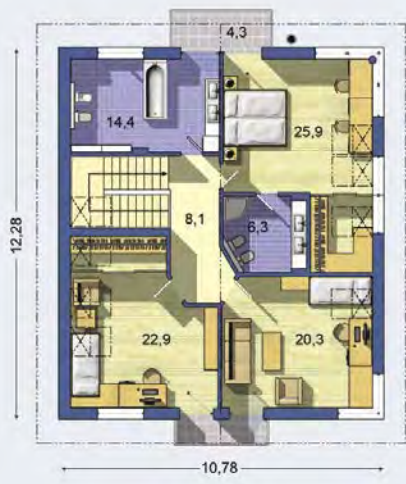
POSCHODIE [celková plocha 97.8 m 2 ]

Návrh dispozície pôdorysu rodinného domu je architektonickým dielom podľa § 3 ods. 6 Autorského zákona č. 185/2015 zb. Jeho porušenie je trestné podľa § 283 Trestného zákona.