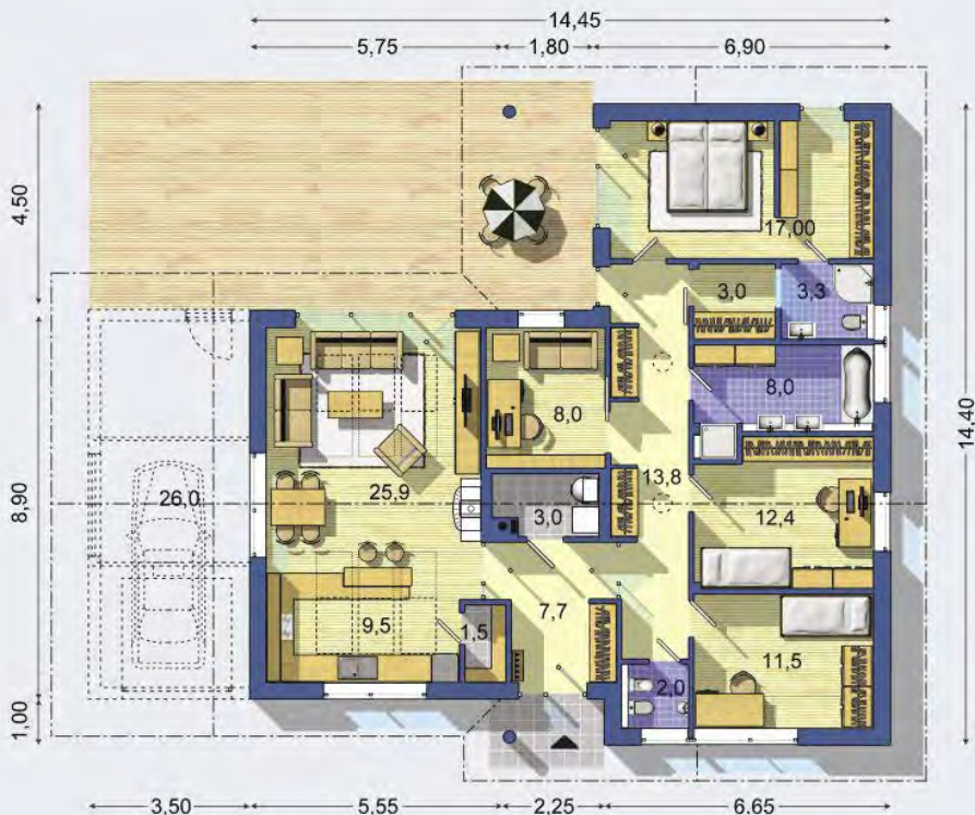
PRÍZEMIE [celková plocha 126.4 m 2 ]

Návrh dispozície pôdorysu rodinného domu je architektonickým dielom podľa § 3 ods. 6 Autorského zákona č. 185/2015 zb. Jeho porušenie je trestné podľa § 283 Trestného zákona.