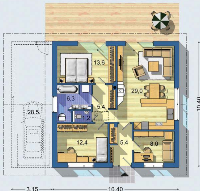
PRÍZEMIE [celková plocha 81.3 m 2 ]

Návrh dispozície pôdorysu rodinného domu je architektonickým dielom podľa § 3 ods. 6 Autorského zákona č. 185/2015 zb. Jeho porušenie je trestné podľa § 283 Trestného zákona.