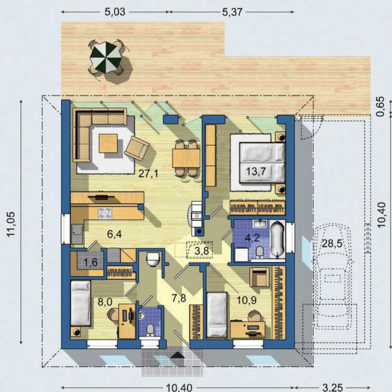
PRÍZEMIE [celková plocha 84.6 m 2 ]

Návrh dispozície pôdorysu rodinného domu je architektonickým dielom podľa § 3 ods. 6 Autorského zákona č. 185/2015 zb. Jeho porušenie je trestné podľa § 283 Trestného zákona.