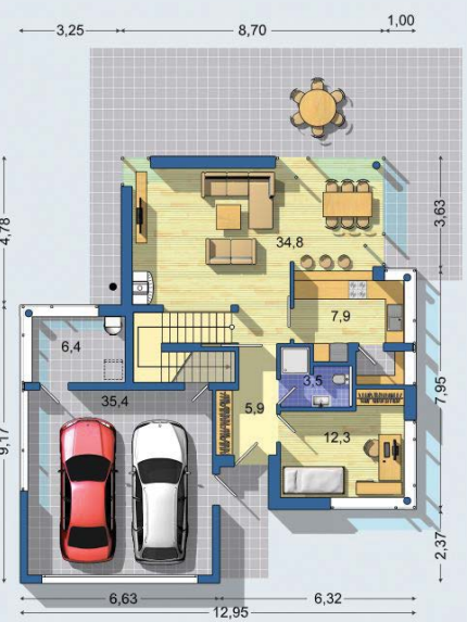
PRÍZEMIE [celková plocha 118.9 m 2 ]