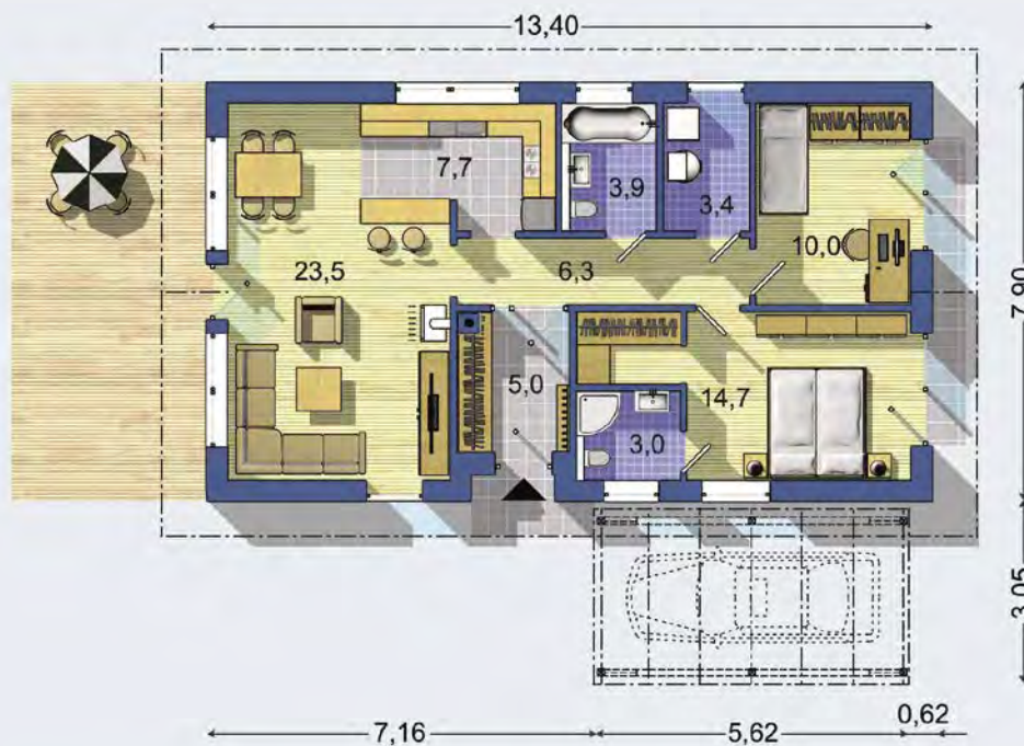
PRÍZEMIE [celková plocha 77.3 m 2 ]

Návrh dispozície pôdorysu rodinného domu je architektonickým dielom podľa § 3 ods. 6 Autorského zákona č. 185/2015 zb. Jeho porušenie je trestné podľa § 283 Trestného zákona.