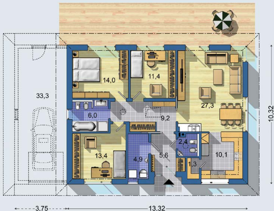
PRÍZEMIE [celková plocha 105.6 m 2 ]

Návrh dispozície pôdorysu rodinného domu je architektonickým dielom podľa § 3 ods. 6 Autorského zákona č. 185/2015 zb. Jeho porušenie je trestné podľa § 283 Trestného zákona.