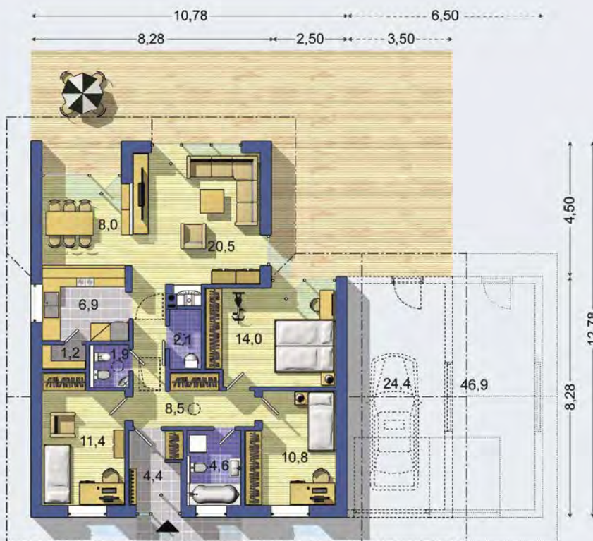
PRÍZEMIE [celková plocha 94.2 m 2 ]

Návrh dispozície pôdorysu rodinného domu je architektonickým dielom podľa § 3 ods. 6 Autorského zákona č. 185/2015 zb. Jeho porušenie je trestné podľa § 283 Trestného zákona.