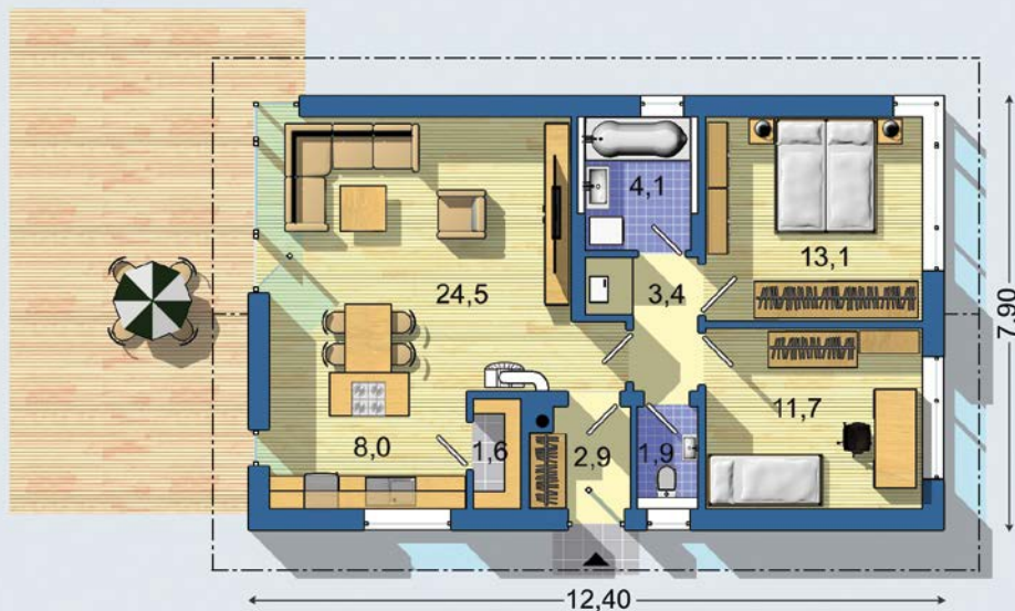
PRÍZEMIE [celková plocha 71.2 m 2 ]

Návrh dispozície pôdorysu rodinného domu je architektonickým dielom podľa § 3 ods. 6 Autorského zákona č. 185/2015 zb. Jeho porušenie je trestné podľa § 283 Trestného zákona.