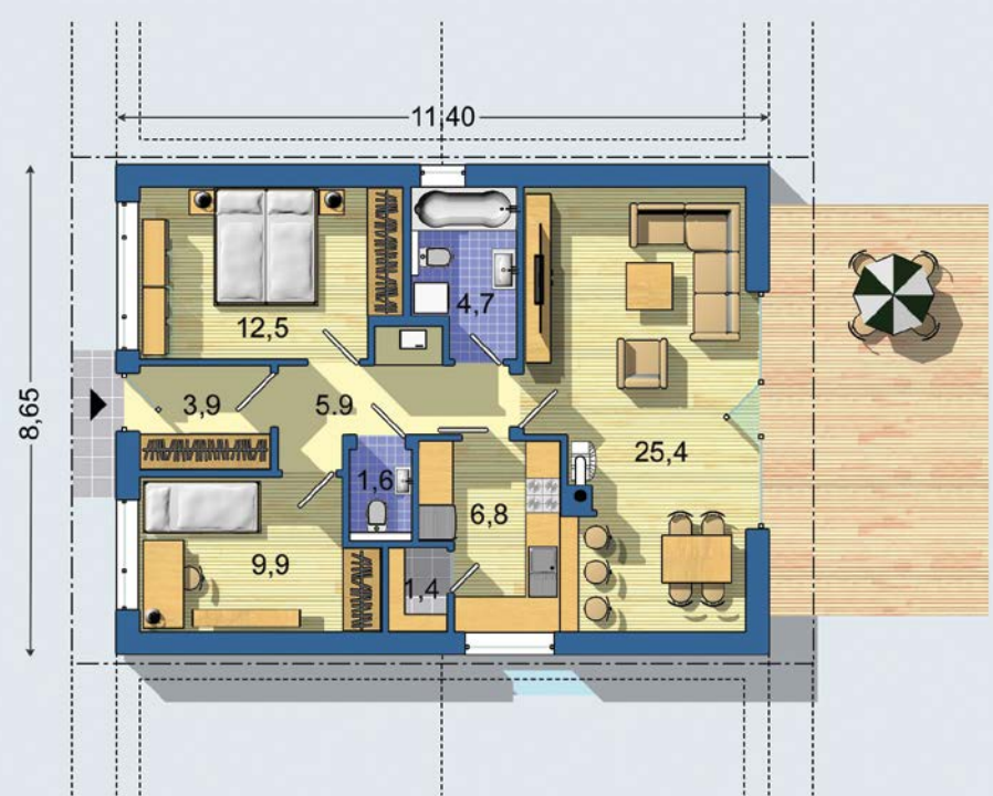
PRÍZEMIE [celková plocha 72.2 m 2 ]

Spôsob vykurovania: podlahové vykurovanie Predpokladané náklady na vykurovanie pre zdroj: tepelné čerpadlo 17 €/mesiac plynový kotel 24 €/mesiac