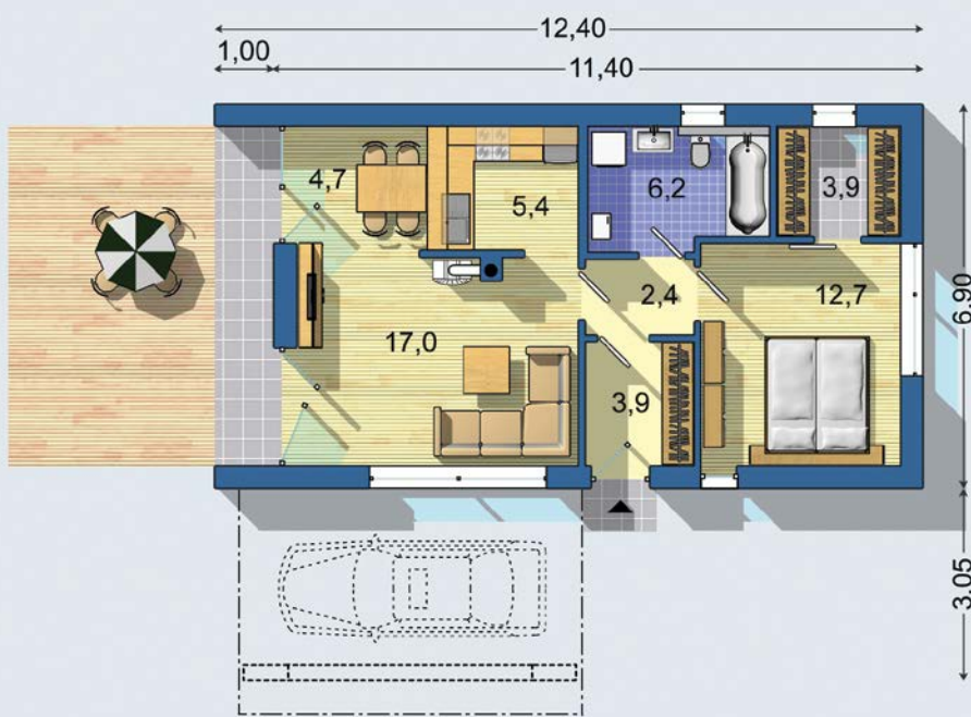
PRÍZEMIE [celková plocha 56.2 m 2 ]