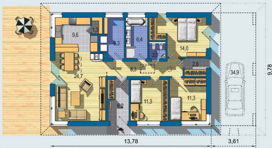
PRÍZEMIE [celková plocha 104.0 m 2 ]

Návrh dispozície pôdorysu rodinného domu je architektonickým dielom podľa § 3 ods. 6 Autorského zákona č. 185/2015 zb. Jeho porušenie je trestné podľa § 283 Trestného zákona.