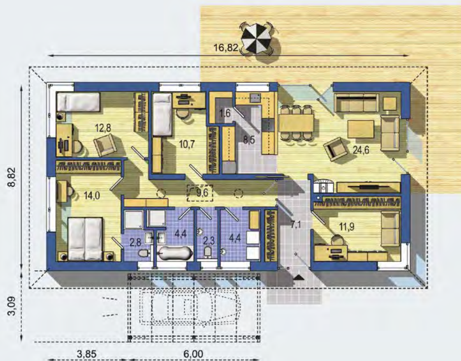
PRÍZEMIE [celková plocha 114.5 m 2 ]

Návrh dispozície pôdorysu rodinného domu je architektonickým dielom podľa § 3 ods. 6 Autorského zákona č. 185/2015 zb. Jeho porušenie je trestné podľa § 283 Trestného zákona.