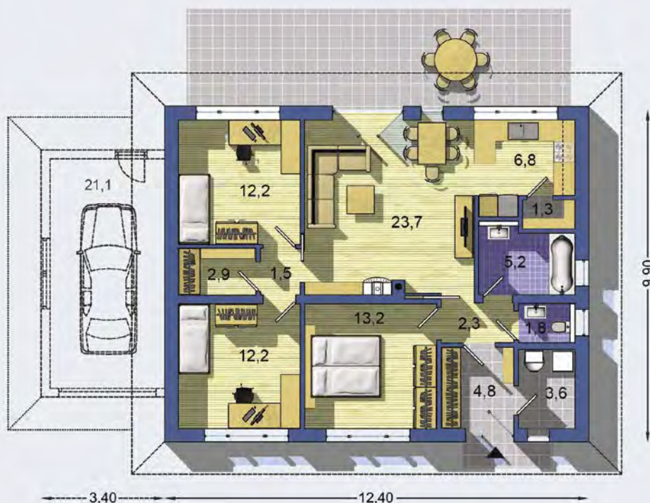
PRÍZEMIE [celková plocha 91.5 m 2 ]

Návrh dispozície pôdorysu rodinného domu je architektonickým dielom podľa § 3 ods. 6 Autorského zákona č. 185/2015 zb. Jeho porušenie je trestné podľa § 283 Trestného zákona.