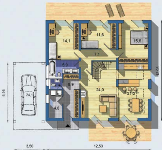
PRÍZEMIE [celková plocha 114.7 m 2 ]