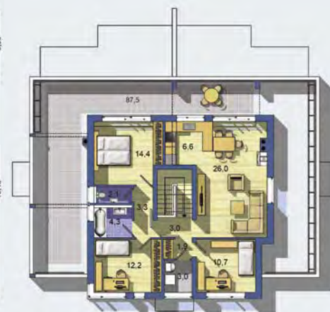
POSCHODIE [celková plocha 175.0 m 2 ]