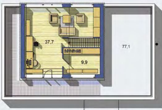
POSCHODIE [celková plocha 125.2 m 2 ]