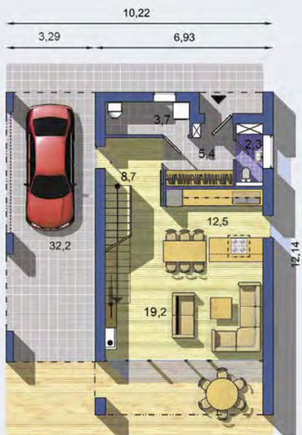
PRÍZEMIE [celková plocha 52.7 m 2 ]