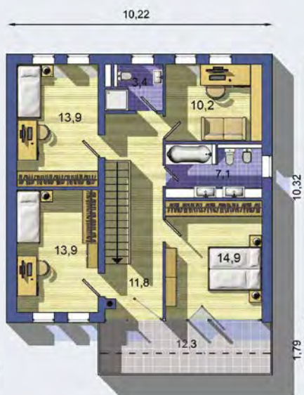
POSCHODIE [celková plocha 87.8 m 2 ]

Návrh dispozície pôdorysu rodinného domu je architektonickým dielom podľa § 3 ods. 6 Autorského zákona č. 185/2015 zb. Jeho porušenie je trestné podľa § 283 Trestného zákona.