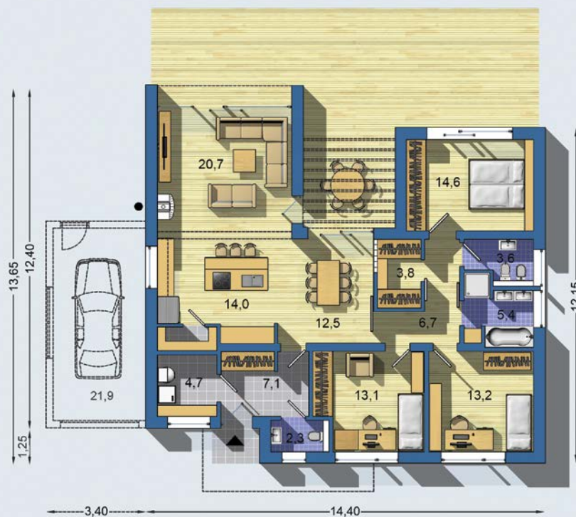
PRÍZEMIE [celková plocha 123.7 m 2 ]