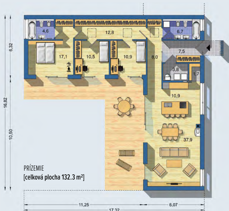
PRÍZEMIE [celková plocha 132.3 m 2 ]

VILA 1964 - prízemný moderný dom s racionálnou dispozíciou vhodný do radovej zástavby - v prípade radovej zástavby rodinné domy ohraničujú súkromné átriá - vzdušný obytný veľkopriestor tvorený obývacou izbou, jedálňou a kuchyňou - kuchynský ostrovček s barovým sedením - všetky obytné miestnosti orientované do súkromnej časti pozemku s priamym vstupom na terasu - oddelená denná a nočná zóna domu - dostatok úložných priestorov - dve kúpeľne - sklad potravín - - -